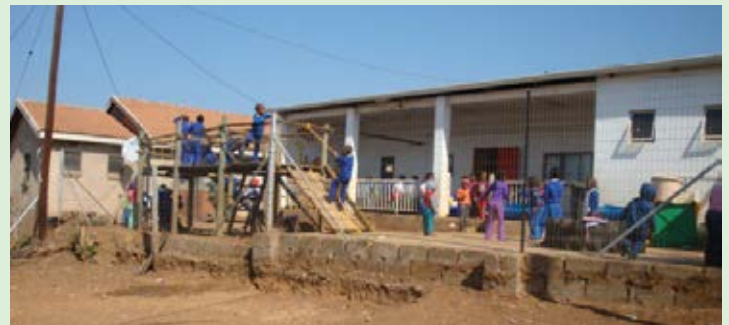
Die nuwe heining word by God's Little Lambs opgerig.