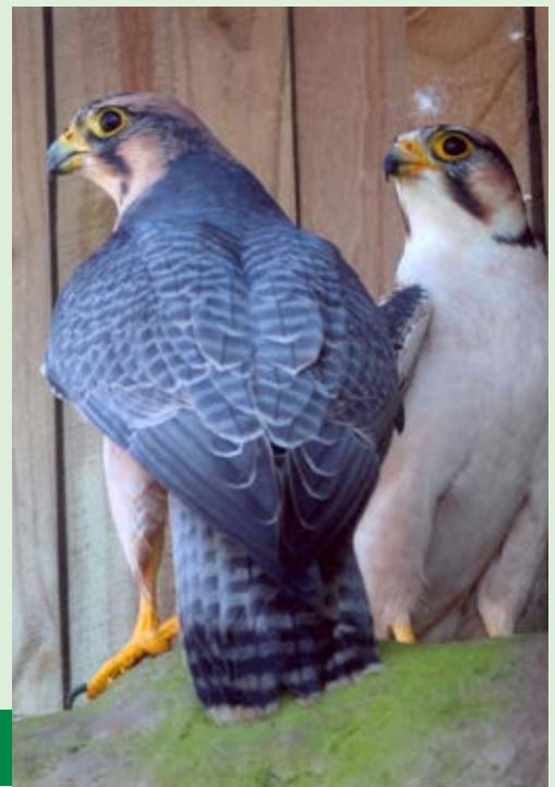
Solo (links), die valk wat deur Falcon Agricultural Equipment geborg word.