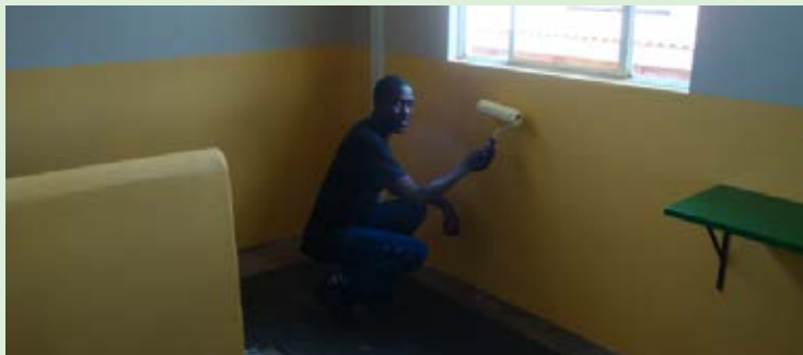
'n Nuwe laag verf vir God's Little Lambs.

Ons aangenome kleuterskool, God's Little Lambs, het nog altyd 'n baie spesiale plek in ons harte gehad. God's Little Lambs maak baie staat op die goedhartigheid van ander, en toe ons hoor dat die skool 'n dringende behoefte aan herverf het, asook aan 'n nuwe veiligheidsheining vanweë onlangse uitbreiding, het ons die materiaal en arbeid geskenk om die binnekant van die skool nuut te verf, asook om die nuwe heining vir die nuut-aangeskafte eiendom op te rig.