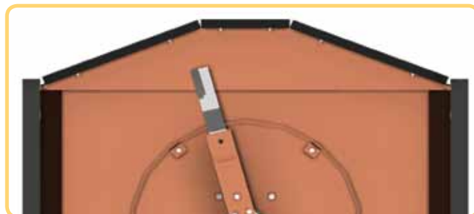
Die Falcon F80/200VH Hooimaker® met Blowermower™-lemme (H1460)

As jy dit nie ontvang het nie, vra asseblief jou Streeksverkoopsbestuurder om dit aan jou te stuur. Die partnommer vir die Falcon F80/200VH Hooimaker® is A0083 en die aanbevole kleinhandelprys is R38 400, BTW uitgesluit.