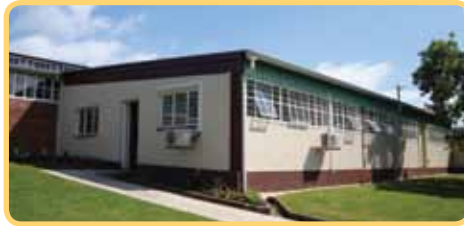
Die opleidingsruimte van buite gesien

akkommodeer. Ons sal ons verkopevergaderings en handelaaropleiding hier aanbied.