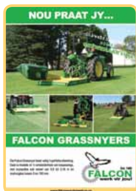
Die nuwe Falcon Grassnyerplakkaat

Hierdie promosie word belig in die NUUS-afdeling van www.falconequipment.co.za . Omdat baie besoekers die webtuiste besoek, sal dit 'n bewustheid van die spesiale aanbod verhoog. As jy enige navrae het, of oor jou betrokkenheid by die promosie wil gesels – en sodat jy jou grassnyerverkope kan vermeerder – kontak jou Streeksverkoopsbestuurder so gou moontlik.