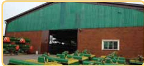
Die ingang na die nuwe 1 200 m 2 wat by die fabriek gevoeg is

Vanweë die sukses wat Falcon Agricultural Equipment (Edms.) Bpk. bereik het in terme van die toenemende volumes en 'n groter verskeidenheid van handelsmerke en implemente, het dit nodig geword om ons fabriek uit te brei en 'n vierde vleuel te skep. Die totale vloeroppervlakte is gevolglik met 1 200 m 2 vergroot, wat ons toegelaat het om ons werksruimte heeltemal op te knap.