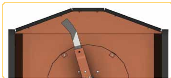
Die Falcon F80/200V Hooimaker® met “piesang”-hoilemme (H1809)

Die besonderhede van die F80/200VH Hooimaker® verskyn in Handelaarsbulletin 4 van 2012.