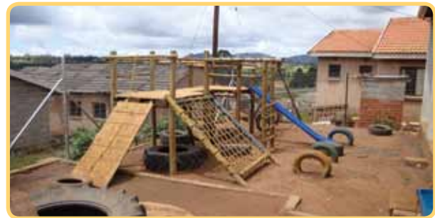
Die omheinde speelterrein agter

Die plaaslike preprimêre skool wat ons ondersteun, God's Little Lambs, moes dringend behoorlik omhein word, gevolglik het ons gegalvaniseerde omheining