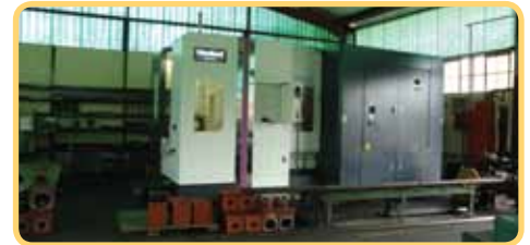
Die nuwe Hartford CNC-Masjineringsentrum

lang, moeitvrye diens in alle toepassings bewys. Hulle is spesifiek ontwerp om die buitengewone werkstoestande in Afrika te kan trotseer en die hoër krag van die nuwegenerasie-trekkers op die mark te kan absorbeer.