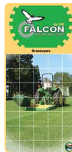
Die nuwe Falcon Grassnyerbrosjyre

Hierdie mediaveldtog duur van Januarie tot Mei 2013. Ons sal in die hoofstroom-landboupublikasies Landbouweekblad en Farmer's Weekly adverteer, omdat ons 'n uitstekende reaksie kry wanneer ons dit doen, maar het ons blootstelling uitgebrei deur Veeplaas en Stockfarm by die mediamengsel te voeg, omdat hierdie twee publikasies bykomende