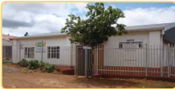
God's Little Lambs se nuwe heining voor

Die plaaslike preprimêre skool wat ons ondersteun, God's Little Lambs, moes dringend behoorlik omhein word, gevolglik het ons gegalvaniseerde omheining